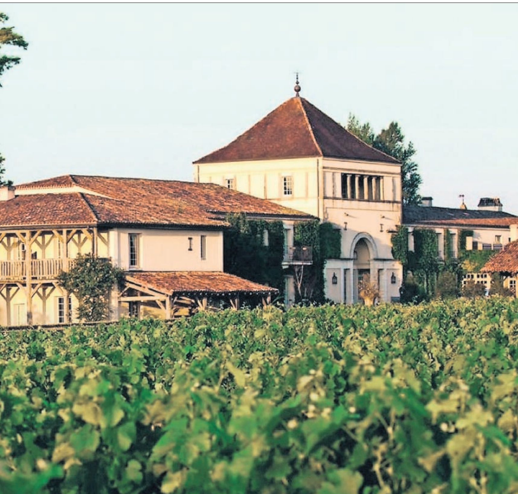
Omgivet af vinmarker, så man skulle tro, det var en vingård, ligger Caudalies spa.